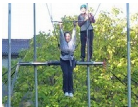
séance de découverte du trapèze volant avec l'IME l'Amitié

Revue de presse : http://www.lartdenfaire.com/pdf/revue-de-presse-handicap.pdf