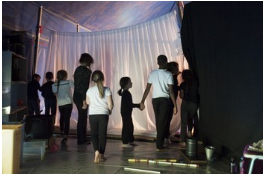
dans les coulisses d'un spectacle de fin de stage