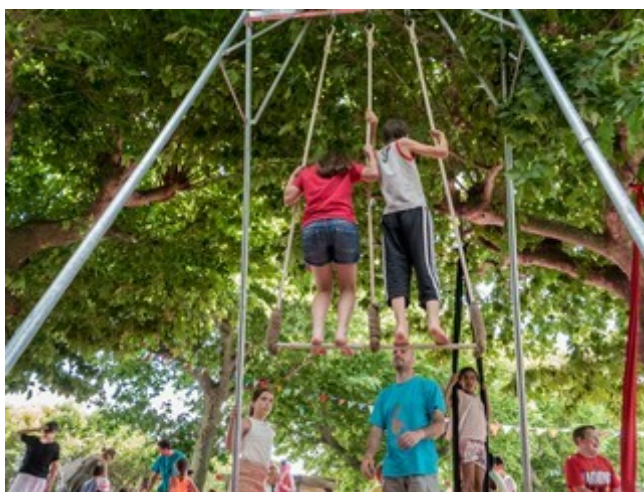
fête des écoles à Payzac