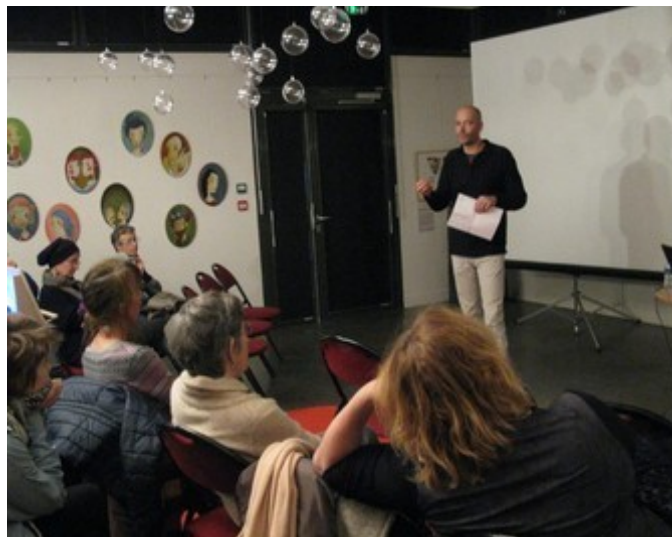
Conférence à la médiathèque Jean Ferrat - Aubenas

- création d'un site internet : travail de construction, le site sera opérationnel au printemps 2017