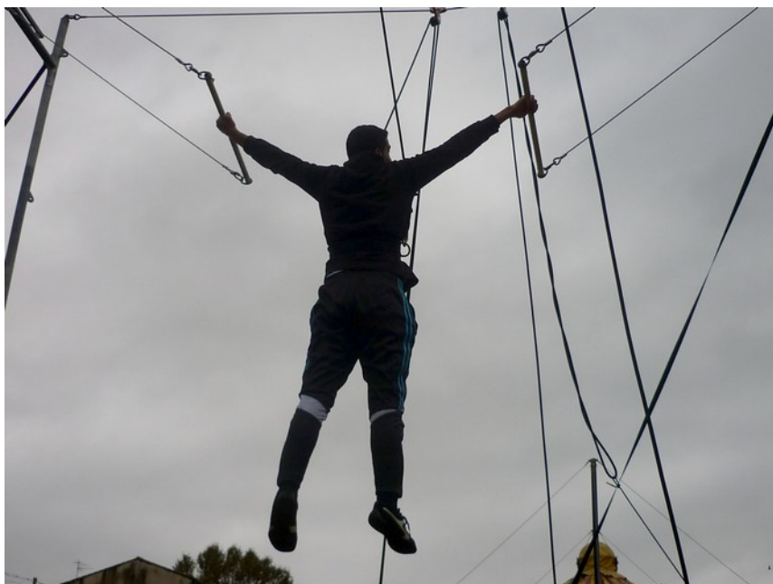
jeune Syrien lors d'une séance de trapèze volant

> financements : Etat (contrat de ville, service vie associative), Aubenas, Département (service vie associative)