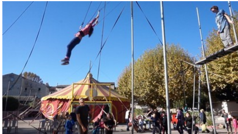
Passerelles cirque à Aubenas - octobre 2016