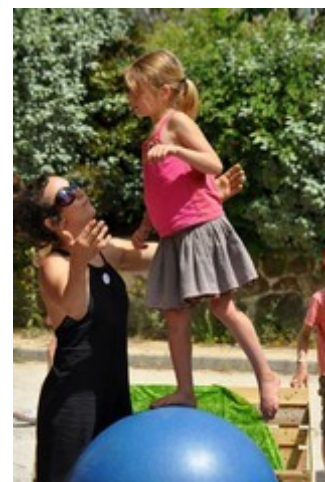
atelier découverte - festival les Oiseaux de Passage