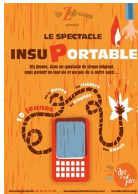
affiche du spectacle mis en place dans le cadre du projet citoyenneté-jeunesse