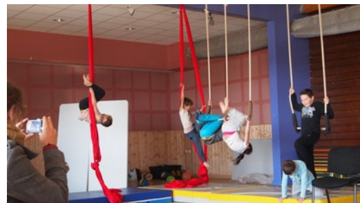
spectacle de fin de cycle - périscolaire à St Michel-de-Boulogne

Le centre de ressource , tant au niveau des malles pédagogiques que des formations a été peu sollicité en dehors d'un prêt de malle matériel, d'une formation pour animateur du périscolaire et d'un accompagnement d'animateur. Nous devons sans doute améliorer nos propositions dans ce domaine.