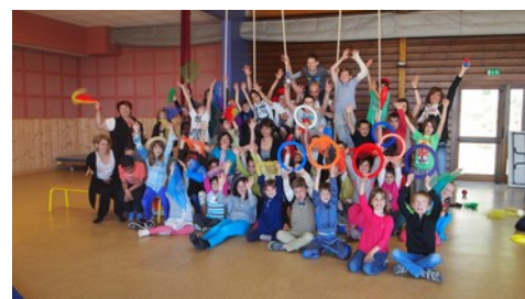
rencontres IME Béthanie - école de St Michel de Boulogne dans le cadre d'un projet mixte handicap/valides

formations : communauté de commune des Gorges de l'Arèche.