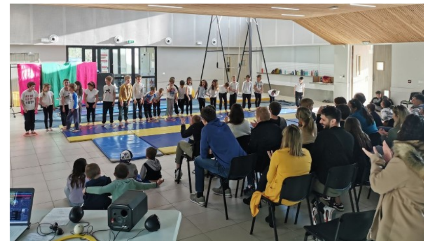
Spectacle de fin de projet – école de Vesseaux