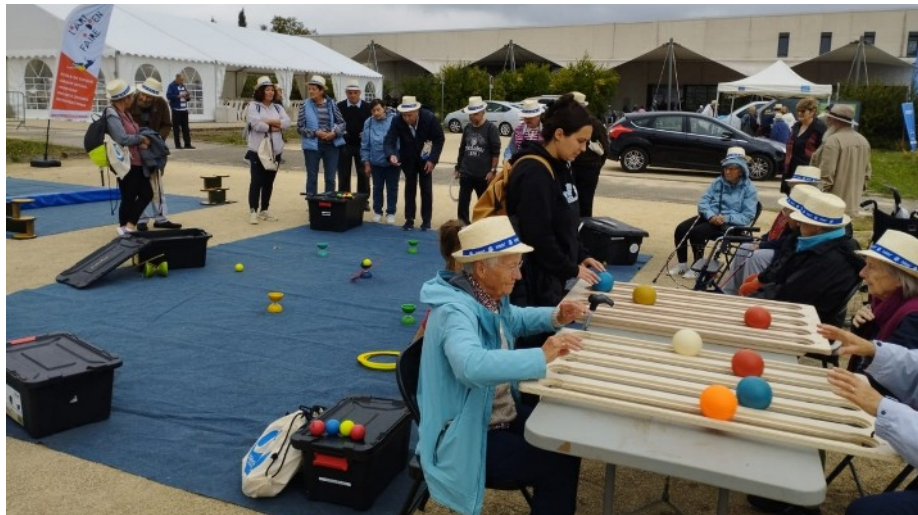
Dans le cadre de la semaine verte - partenariat avec le département