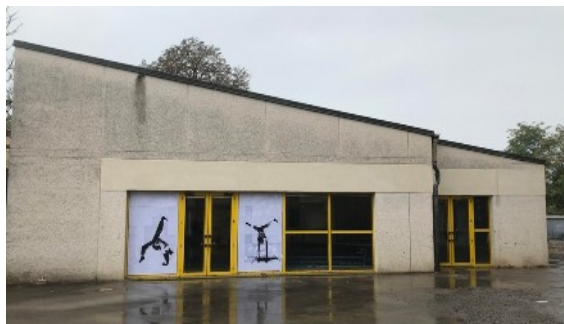
Salle principale vue de l'extérieur