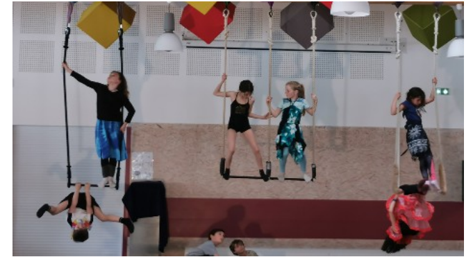
spectacle de fin de stage vacances à Vallon Pt d'Arc