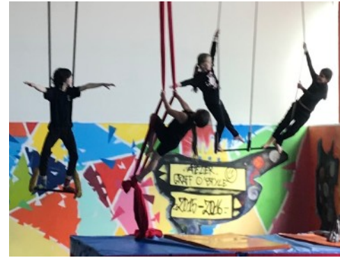
spectacle de fin de stage vacances aux Vans