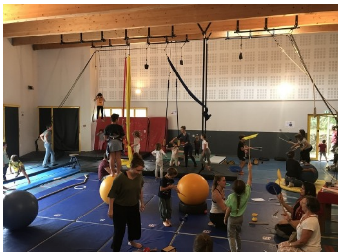
Salle d'activité principale de l'école de cirque