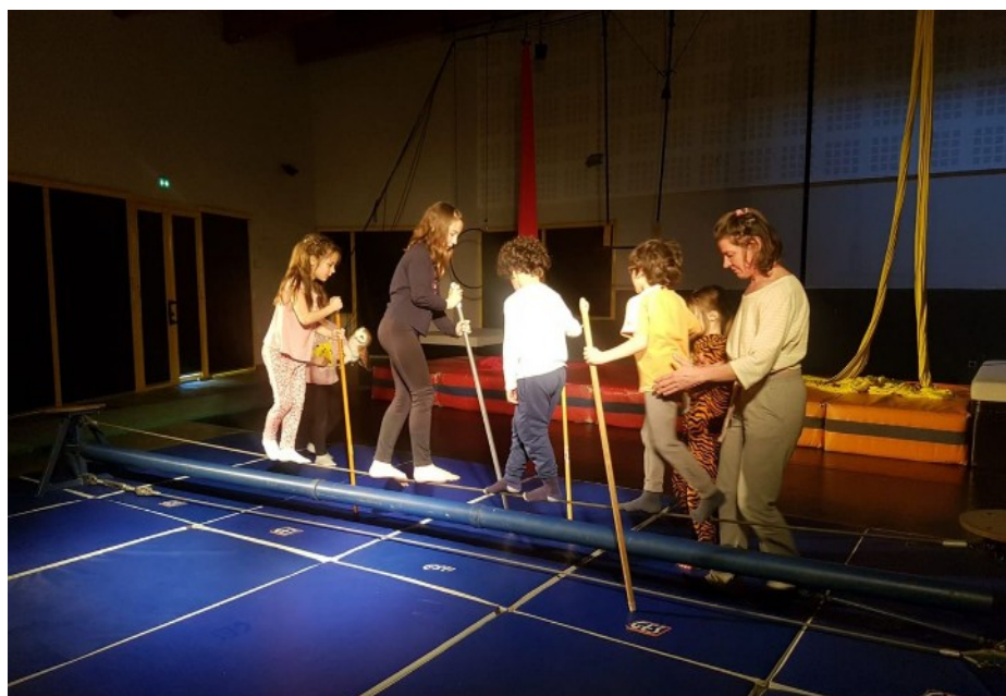
Situation d'inclusion – spectacle de fin de stage vacances à Joyeuse

7 bénéficiaires du dispositif d'inclusion > dispositif membre du projet de recherche/action PaRI : plus d'infos en cliquant ici et en écoutant l'émission de Ici (France Bleu) en cliquant ici