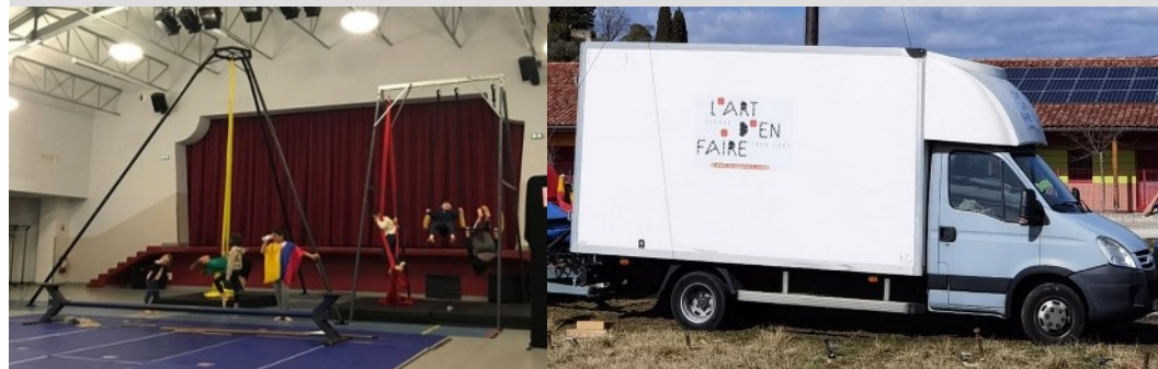
Aménagement ponctuel (stage à Ruoms)

1 véhicule (20m 3 ), 1 fourgonnette (bientôt hors d'usage), du matériel pédagogique mobile et un espace de stockage et de chargement dédié