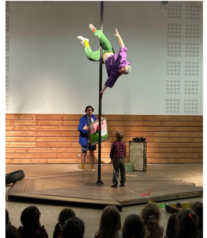
Programmation du spectacle Happy Apocalypse to you Les Enfants sérieux Mois de la créativité en Beaume Drobie - Valgorge