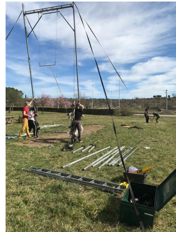
Chantier bénévole : montage du trapèze volant

En aide sur : petits travaux (menuiserie, aménagements, etc.), montage du trapèze volant, installation lors d'évènements, transport des élèves, aide sur les évènements (installation, vente de gâteaux), réunions au sein du Conseil d'administration, accompagnement de l'équipe sur la gestion (regard extérieur, conseil), distribution des supports de com, etc. - environ 40 bénévoles