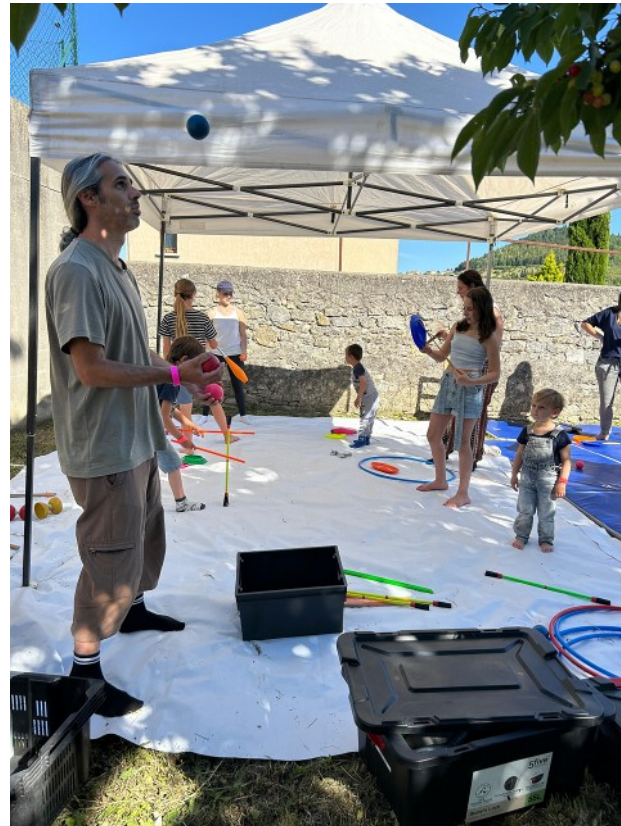
Ateliers découverte – festival d'une cour à l'autre – Villeneuve de Berg